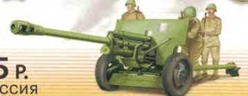
76-мм дивизионная пушка (ЗИС-3)