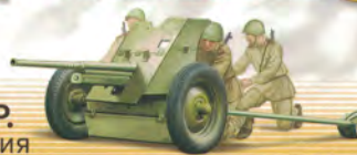
45-мм противотанковая пушка (53-К)